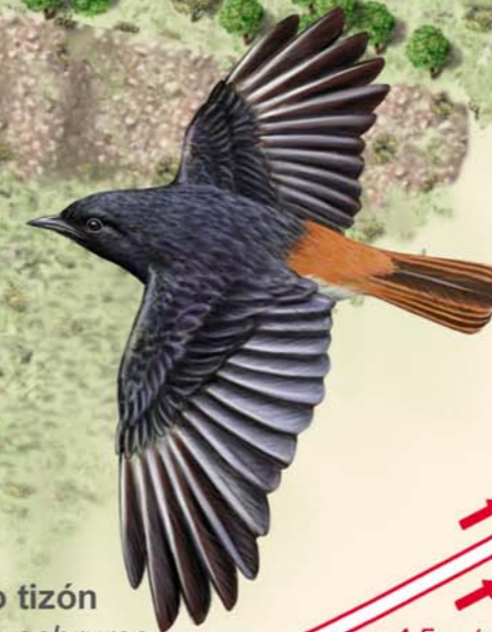
Colirrojo tizón Phoenicurus ochruros