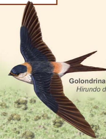
Golondrina dáurica Hirundo daurica