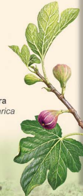
Higuera Ficus carica