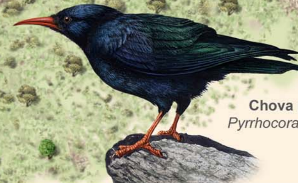
Chova piquirroja Pyrrhcorax pyrrhcorax