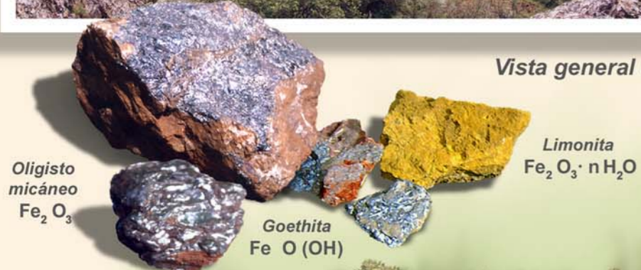
Minerales de hierro