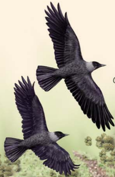
Grajilla Corvus monedula