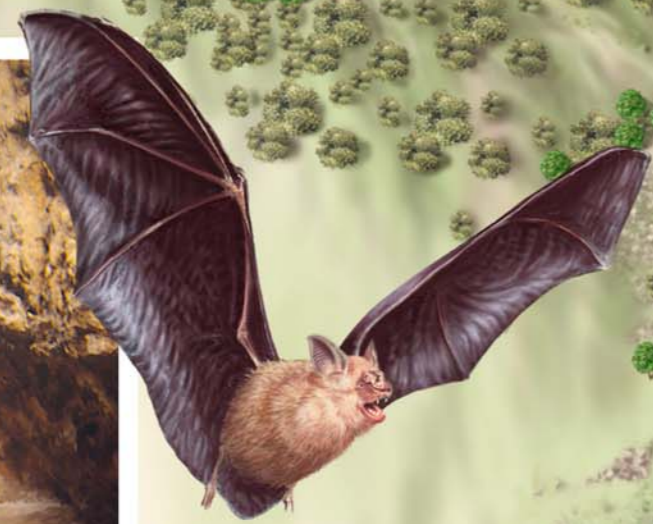
Rinolofo mediano Rhinolophus mehelyi