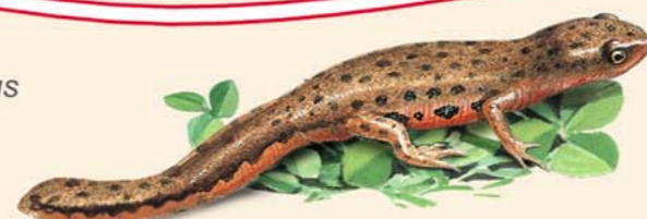
Tritón ibérico Triturus boscai