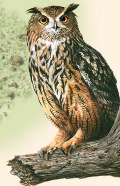
Búho real Bubo bubo