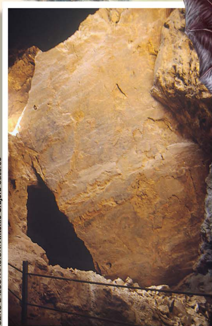
Espejo de falla.