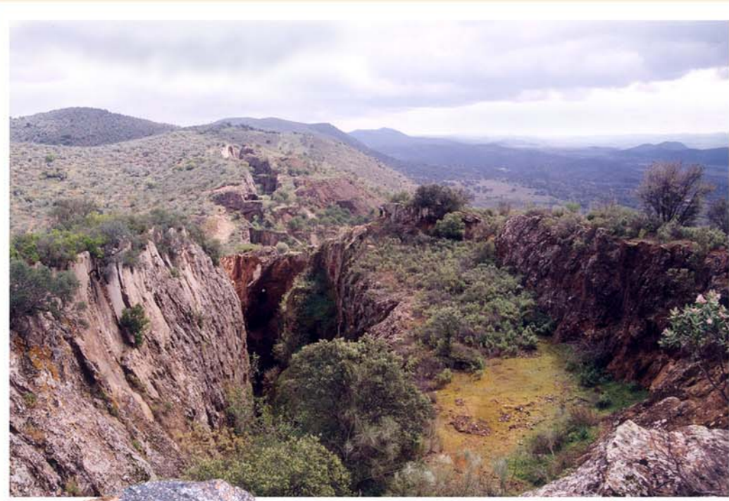
Vista general de la mina.