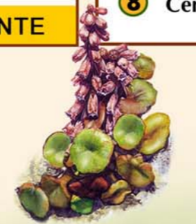
Ombiligo de Venus Umbilicus rupestris