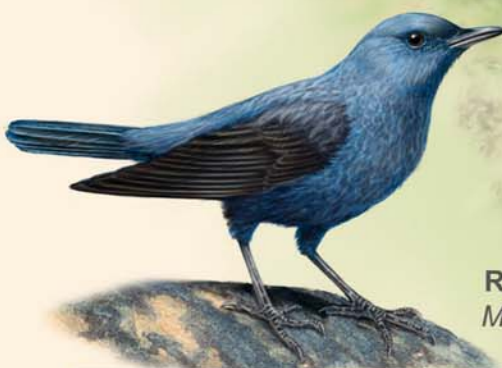
Roquero solitario Monticola solitarius