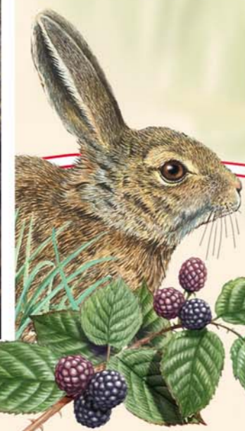
Conejo Oryctolagus cuniculus