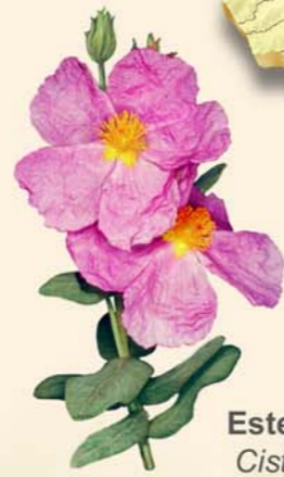
Estepa blanca Cistus albidus