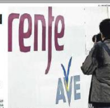
Un trabajador de la alta velocidad en la estación de Madrid.

Los trabajos se inicien en el 2023, pero se estima que los trabajos se inicien en el 2023.