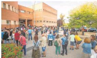
Esperando a que comience el examen, a las diez de la mañana, en la Facultad de Derecho.

No ha sido el SES, desde la víspera de los primeros que salían de hacer exámenes en el Parlamento de Cáceres. «Era en su momento decisivo si iba a haber o no alguna respuesta», decía una de las últimas preguntas que estaban del examen en la Facultad de Derecho. Pero esta respuesta, una jornada experta en estimar