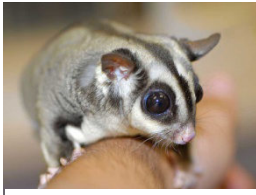
Petauro del azúcar