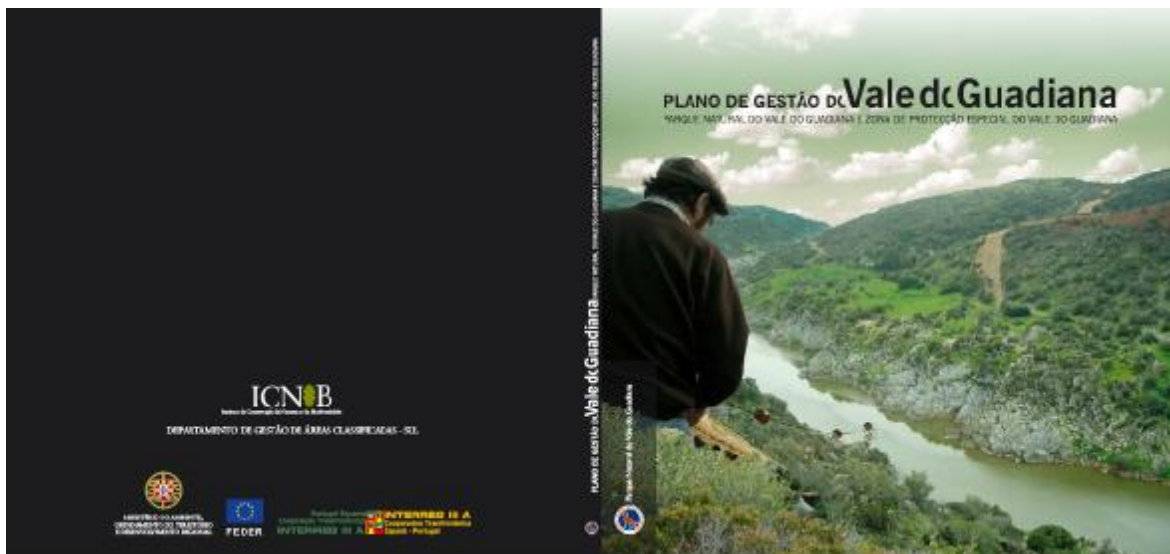
Imagem da capa e verso do Plano de Gestão (edição gráfica)