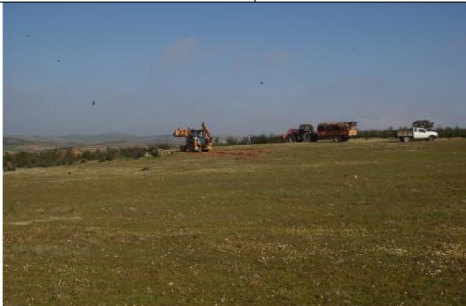
Aspecto geral da acção