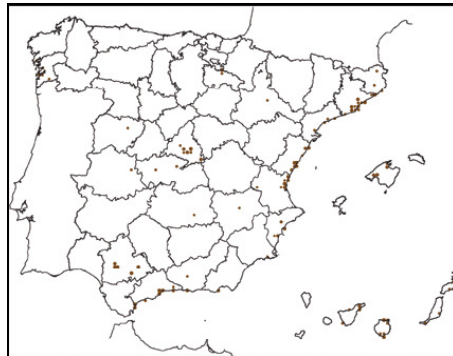
Fte. Ministerio de Agricultura, Alimentación y Medio Ambiente. Atlas de las Aves Reproductoras. Distribución de Psittacula krameri en España (Martí y Del Moral, 2003).

Los principales núcleos reproductores se encuentran en el litoral mediterráneo.