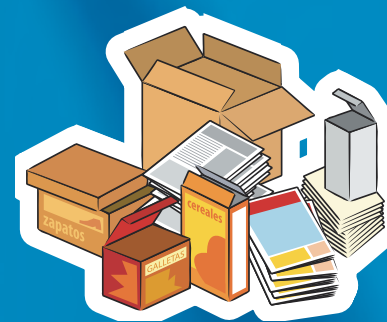
ENVASES DE CARTÓN, PAPEL, PERIÓDICOS Y REVISTAS