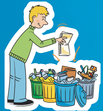
SEPARACIÓN EN EL HOGAR