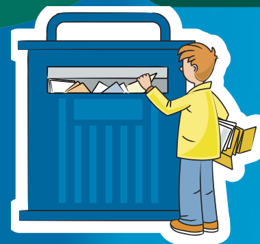
DEPÓSITO EN CONTENEDOR AZUL

Si se mezclan los residuos, se echa a perder el esfuerzo de todos