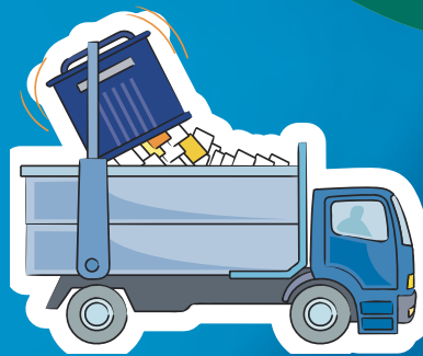
CAMIÓN DE RECOGIDA