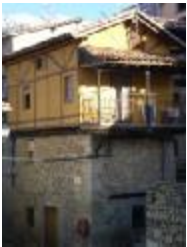
Casas típicas veratas