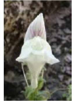
BOCA DE DRAGÓN

Dentro de la Reserva existen plantas que son endémicas de la Sierra de Gredos, es decir, que no existen en otra parte del planeta. A estas plantas hay que cuidarlas más para que no desaparezcan