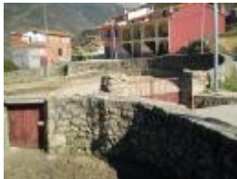
La plaza de toros