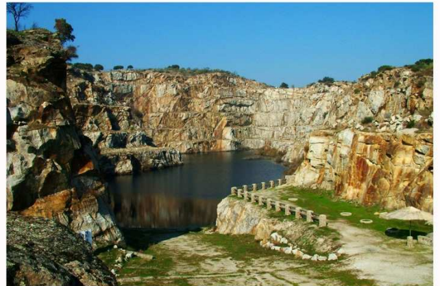
LA CANTERA DEL CABEZO.