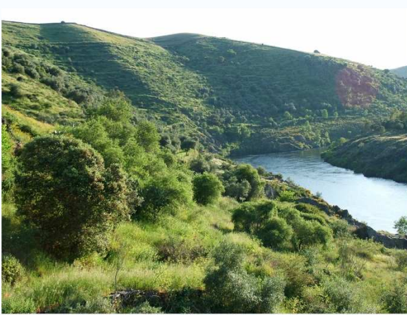
RÍO TAJO EN ALCÁNTARA