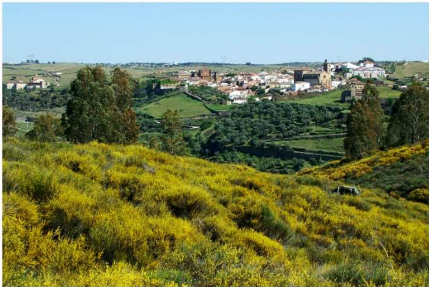
VISTAS DESDE CALZADA ROMANA.