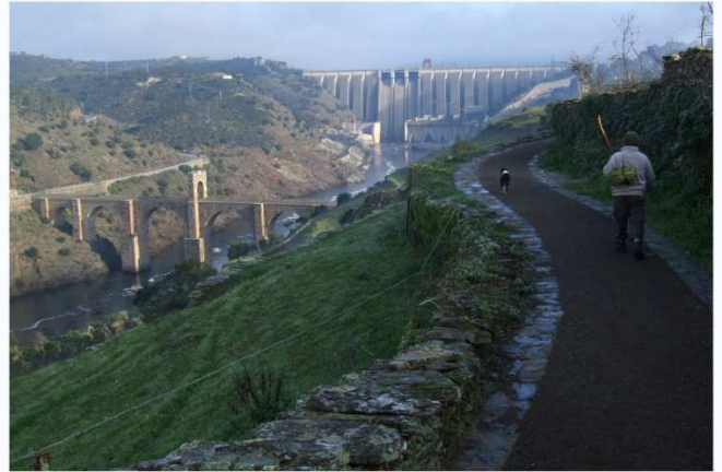
CAMINO NATURAL DEL TAJO.