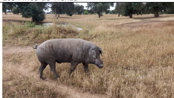
Cerdos ibéricos lampiños en la parte de la ZEPA Llanos y Complejo Lagunar de La Albuera incluida en La Cocosa