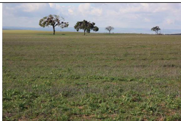
Colonia de cigüeñas en La Cocosa