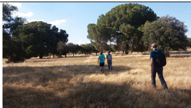
Los Pinos de Tienza