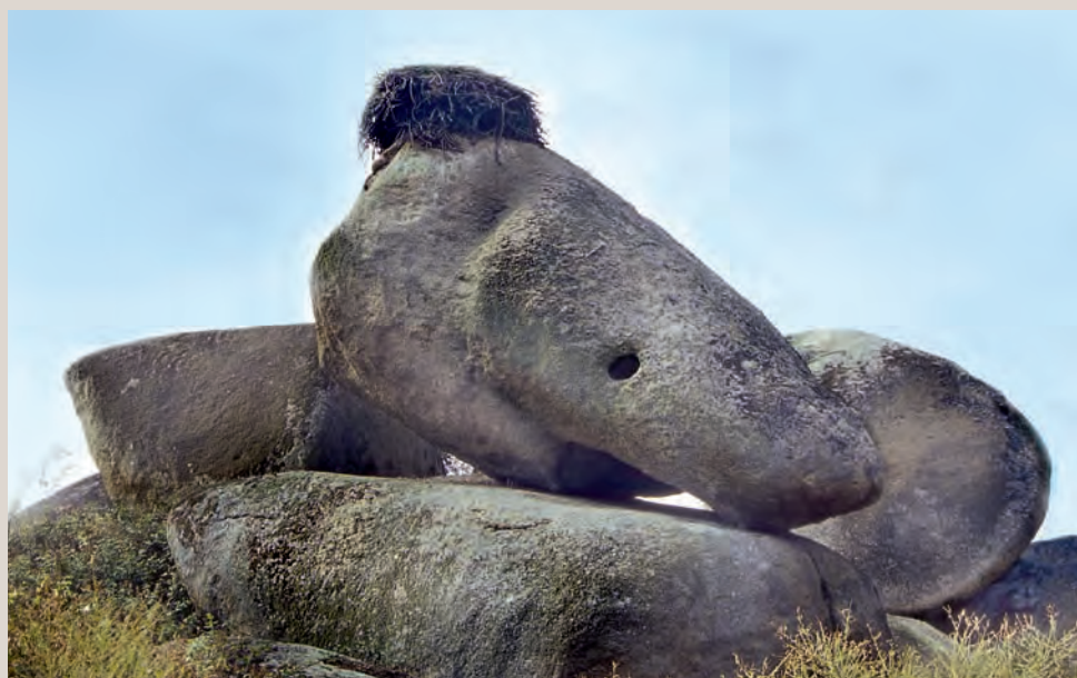
Peña del tiburón.

Evolución del paisaje en Los Barruecos: Desde la intrusión del granito hasta la situación actual como consecuencia de la fracturación, diaclasamiento y meteorización.