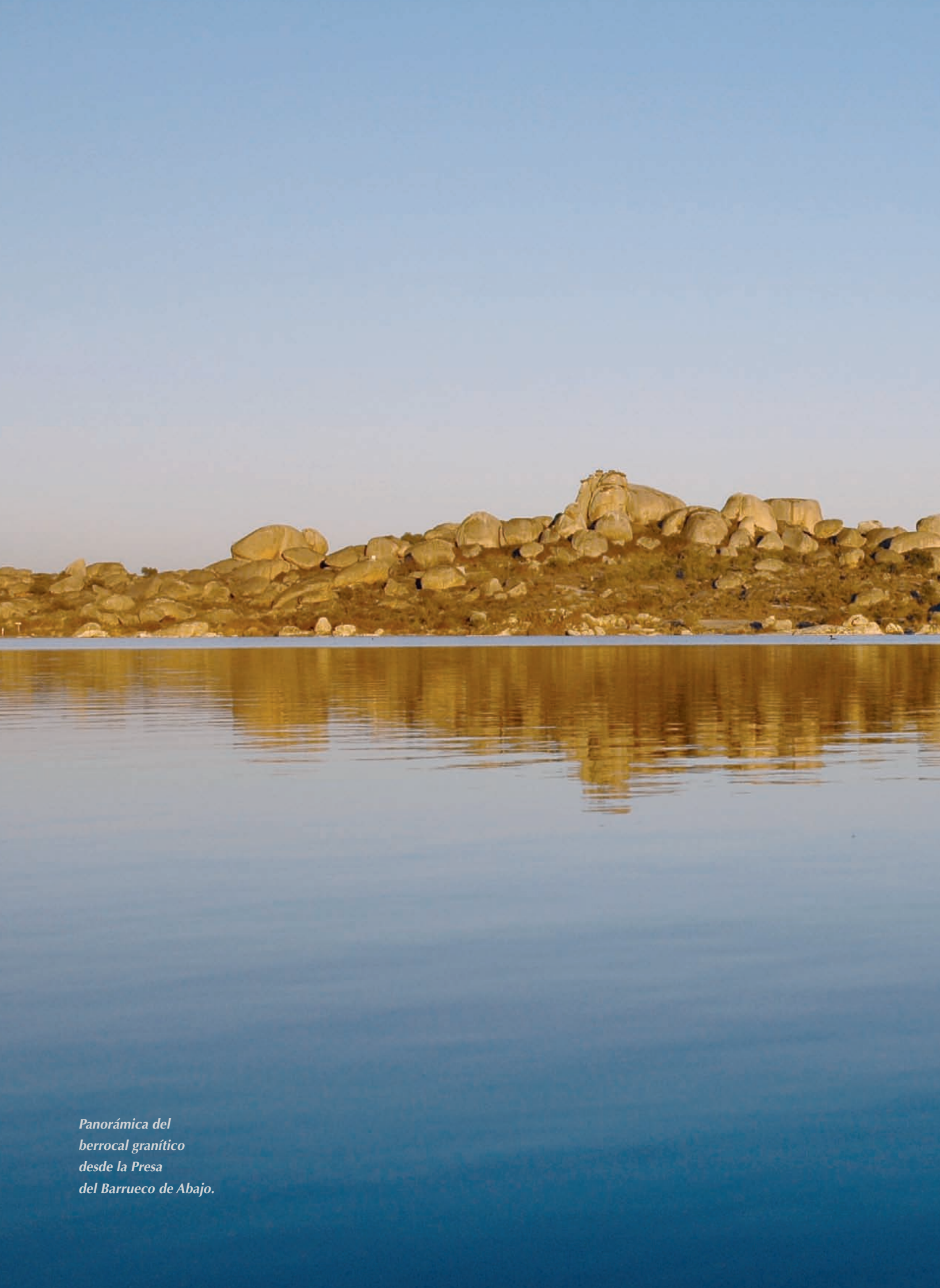
Panorámica del berrocal granítico desde la Presa del Barrueco de Abajo.