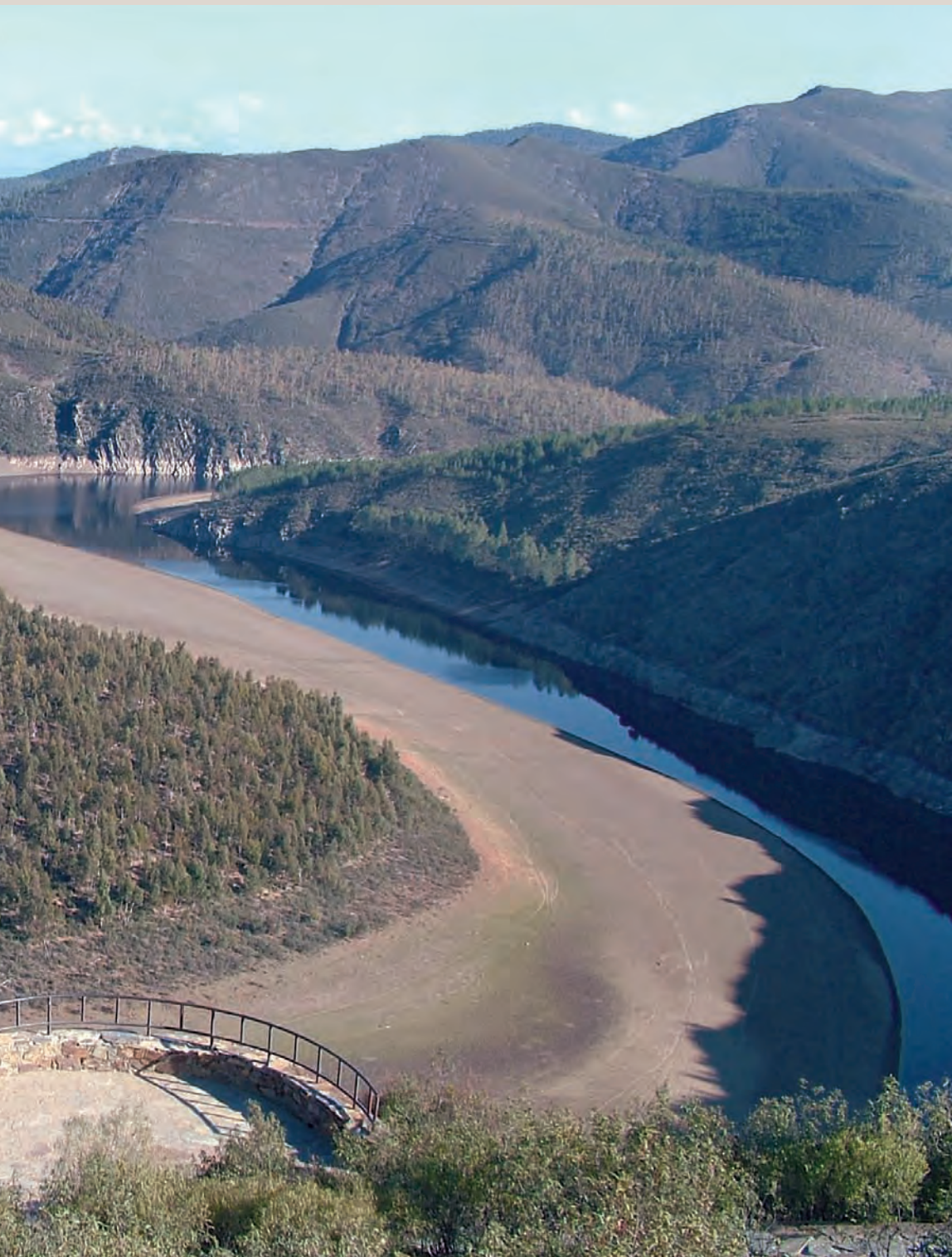
Panorámica de uno de los meandros más singulares de la zona, sobre el río Alagón, marcando el límite entre la provincia salmantina y la cacereña.

La comarca de Las Hurdes reúne asimismo un conjunto de valores naturales y culturales que la hacen enormemente atractiva al visitante, valga como ejemplo las arquitecturas rurales elaboradas con pizarras que parecen estar adosadas a las laderas agrestes y empinadas de esta dura geografía.