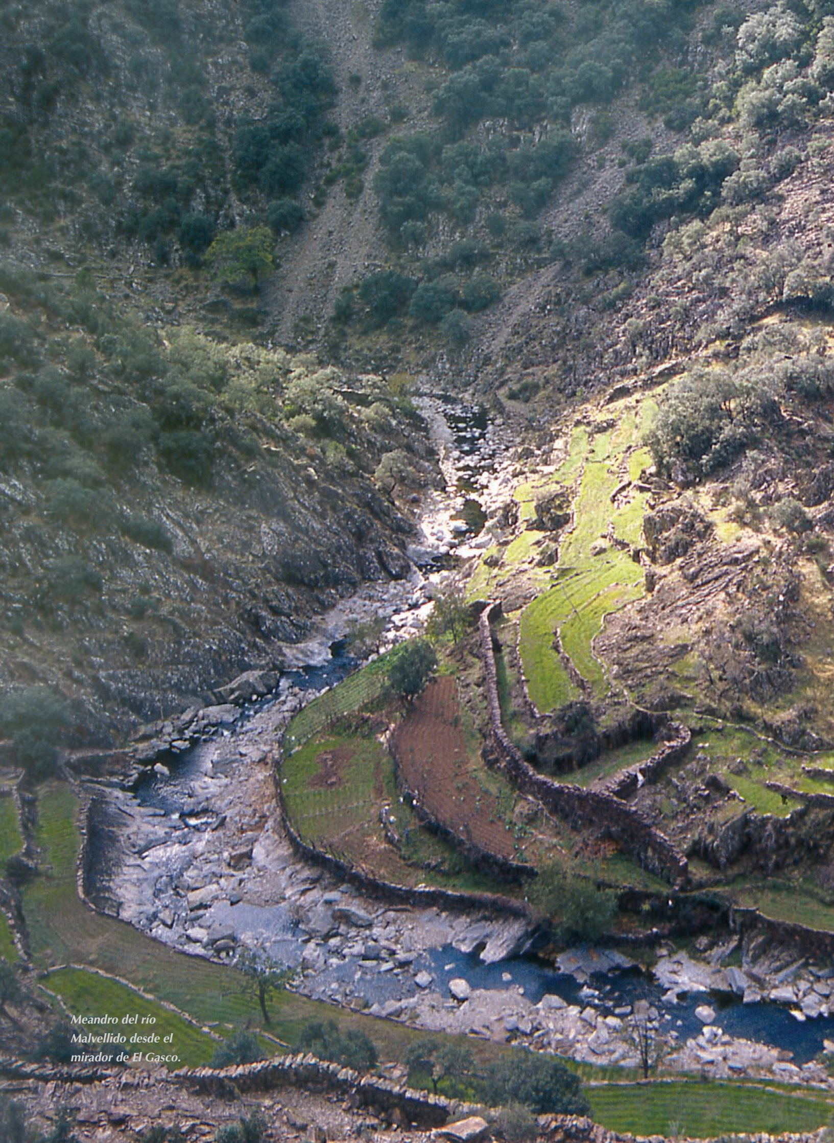
Meandro del río Malvellido desde el mirador de El Gasco.