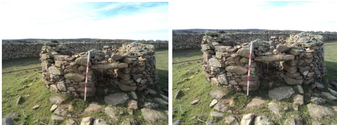
Figura 35 y 36: dos zahúrdas de mampostería de pizarra y cuarcita, ambas de unos 3 metros de diámetro y unos 50 cm de grosor de muro. La de la izquierda conserva un alto máximo de 1.30 metros y una pequeña puerta de apenas 40 cm de alto, mientras el de la derecha está peor conservado y apenas conserva un metro de alto. Sus coordenadas son: UTM: 29 N 713695/4227310 .

conservado y apenas conserva un metro de alto. Sus coordenadas son: UTM: 29 N 713695/4227310 .