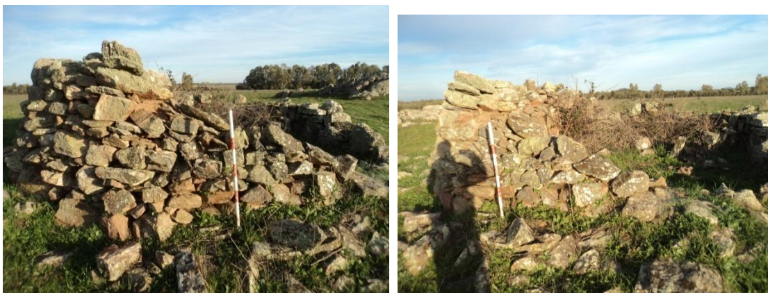
Figura 41 y 42: Parcela contigua a la Parcela 37 del polígono 4: documentamos un chozo de planta circular de mampostería de cuarcita y pizarra que conservaba un alto de muro de 1.30