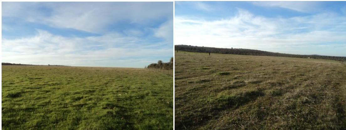
Figura 39 y 40: Parcela contigua a la Parcela 37 del polígono 4 con un terreno llano despejado, con una visibilidad optima del suelo y donde no había mucho pasto ni vegetación arbórea.