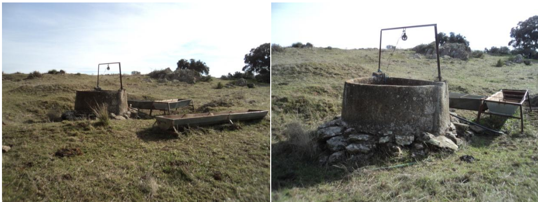
Figura 25 y 26: Parcela contigua a la Parcela 80 del polígono 4: pozo de brocal de ladrillo contemporáneo lucido de cemento