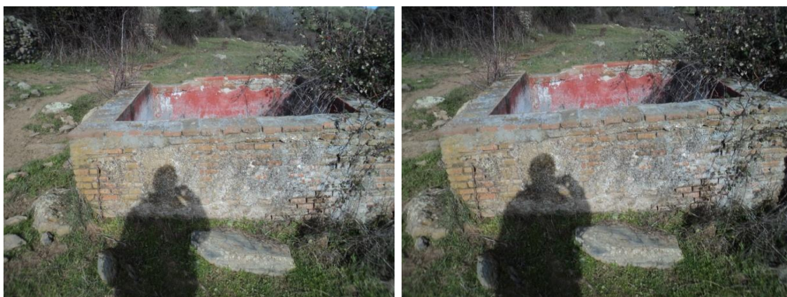
Figura 67 y 68: Pilón contemporáneo para abrevadero del ganado.