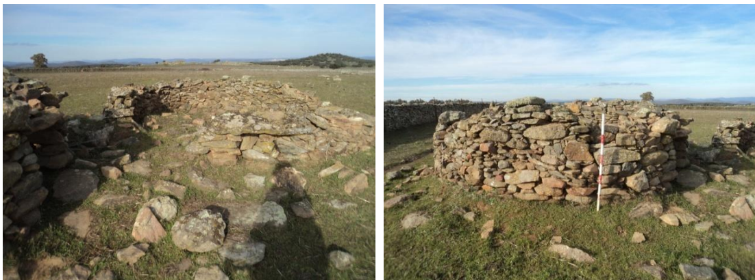
Figura 33 y 34: dos zahúrdas de mampostería de pizarra y cuarcita, ambas de unos 3 metros de diámetro y unos 50 cm de grosor de muro. La de la izquierda conserva un alto máximo de 1.30 metros y una pequeña puerta de apenas 40 cm de alto, mientras el de la derecha está peor