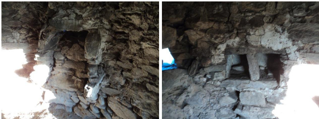
Figura 55 y 56: Chozo construido en mampostería de pizarra cuarzo y cuarcita, de planta circular con muros de 50 cm de grosor, la puerta tiene 1.60 metros de alto por 80 cm ancho, la cubierta está formada por una bóveda de aproximación de hiladas de pizarra y presenta enlucido de cal y arena. El alto total del chozo es de 3.50 metros y un diámetro de 3 metros y en su interior presenta pequeños vanos a modo alacena (3 alacenas y una ventana). Sus coordenadas son: UTM: 29N 714605/4226547.