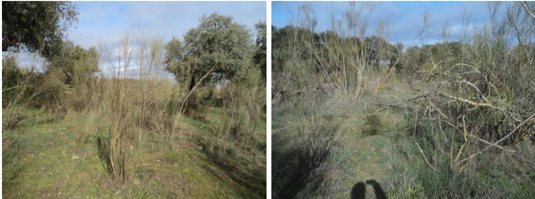
Figura 69 y 70: Zonas de matorral en las que la visibilidad era reducida o nula