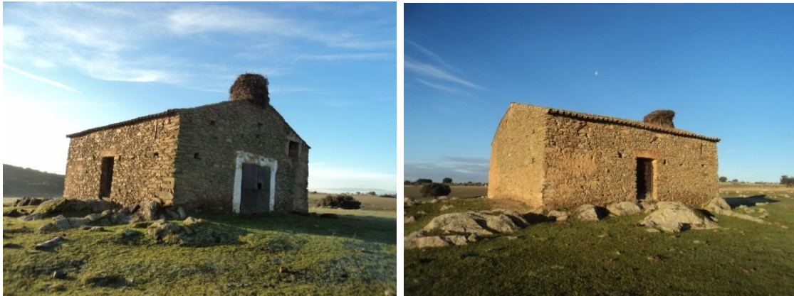
Figura 49 y 50: casa de labor contemporánea construida con mampostería de lajas de pizarra y restaurada para la labor agrícola.