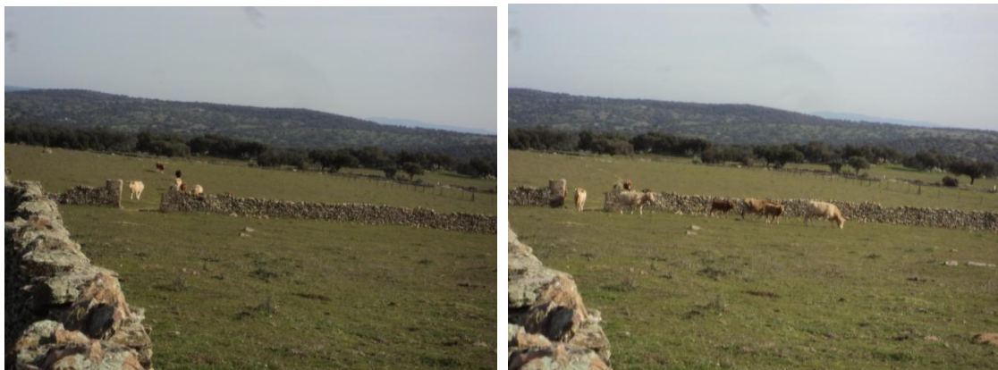
Figura 27 y 28: parcela 84 del polígono 4 donde tampoco pudimos entrar también por la presencia de ganado vacuno, obligando al equipo a dar de nuevo un rodeo y a volver al coche para continuar con los siguientes parques.

El siguiente paso de la prospección fueron los polígonos más cercanos a la carretera BA160 donde dejamos el coche e iniciar desde ahí los trabajos por las parcelas ya del paraje denominado como Ginanvar formado por múltiples cercados de piedra que ha habido que sortear para explotación ganadera ovina, en las cuales eran llanos con visibilidad optima del suelo porque no había mucho pasto. En este paraje no hemos tenido muchos problemas a excepción de las paredes de roca, que ha costado un poco saltar, y es aquí en este paraje donde documentamos dos elementos de interés etnográfico situados uno al lado del otro; se trata de dos zahúrdas de mampostería de pizarra y cuarcita, ambas de unos 3 metros de diámetro y unos 50 cm de grosor de muro. La de la izquierda conserva un alto máximo de 1.30 metros y una pequeña puerta de apenas 40 cm de alto, mientras el de la derecha está peor conservado y apenas conserva un metro de alto. Sus coordenadas son: UTM: 29 N 713695/4227310. No obstante, también se observan una gran cantidad, casi una por cerca, de casas de labor agrícola y ganadera, algunas muy restauradas y en uso actual, además de algunos pozos contemporáneos, la mayoría con brocales de pizarra levantados y aglutinados cemento.