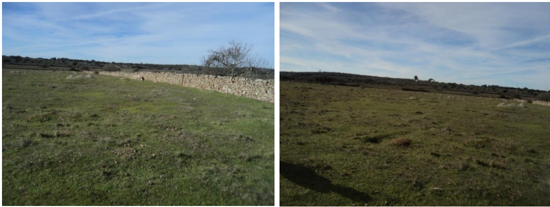
Figura 15 y 16: Aprovechamiento ganadero ovino similar a la anterior donde la visibilidad es óptima

Hecha esta parcela pasamos a otra situada al otro lado de la mencionada vereda y que también se halla delimitada por muros de pizarra y cuarcita, de aprovechamiento ganadero ovino similar a la anterior donde la visibilidad es óptima, en la cual registramos la presencia de otra casa contemporánea encalada para uso ganadero y donde también se observan movimientos de tierra para charcas de abrevadero además de una acumulación de rocas a modo de majano como consecuencia de la actividad agrícola de antaño.