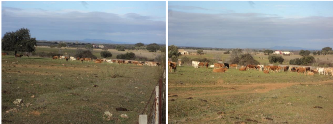
Figura 75 y 76: Paraje Cerca Nueva (Polígono 39 Parcela 11 y Polígono 37 parcela 3) no se pudo entrar por presencia de ganado vacuno