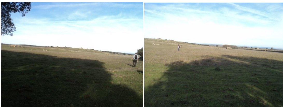
Figura 1 y 2: Vista del terreno parcelas situadas entre el Camino Padrón del Cercado Grande y la Vereda de Bodonal a Jerez de los Caballeros (Visibilidad óptima del terreno)

La prospección arqueológica comenzó el día 13 de Enero de 2020 en los distintos parques que forma la fase 3 de la nueva planta fotovoltaica denominada Cincinato en el paraje llamado Los Llanos comenzando con las pequeñas parcelas situadas entre el Camino Padrón del Cercado Grande y la Vereda de Bodonal a Jerez de los Caballeros, una parcela delimitada con muros de pizarra y cuarcita, y en algunas zonas se aprecia ladrillo contemporáneo macizo. Esta es una parcela llana de aprovechamiento ganadero ovino con una visibilidad óptima pues no hay apenas pasto. En esta parcela se aprecian algunos movimientos de tierra contemporáneos para hacer charcas para abrevadero del ganado. Por su parte, destacamos la presencia de algunos elementos de época contemporánea: unos pilones hechos de pizarra aglutinados con cemento, y luego un pozo de planta circular también de pizarras junto a una casa de planta cuadrangular que en su tiempo estuvo techada a dos aguas con teja árabe sobre vigas de madera, y que actualmente se halla hundido.