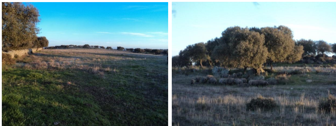
Figura 45 y 46: Parcelas de Cincinato que se hallan al otro lado de la BA 160, y en concreto los polígonos 6 parcela 78 perteneciente al paraje llamado El Castejón, y el polígono 6 parcela 79 perteneciente al paraje denominado como Piedra de la Zarza; ambos tienen un paisaje

El día 14 de Enero de 2020 continuamos la prospección comenzando por las dos parcelas de Cincinato que se hallan al otro lado de la BA 160, y en concreto los polígonos 6 parcela 78 perteneciente al paraje llamado El Castejón, y el polígono 6 parcela 79 perteneciente al paraje denominado como Piedra de la Zarza; ambos tienen un paisaje exactamente igual siendo este un llano con pasto muy bajo, con una buena visibilidad del suelo, para aprovechamiento ganadero porcino; separadas ambas parcelas por una calleja entre paredes de mampostería de pizarra y cuarcita.