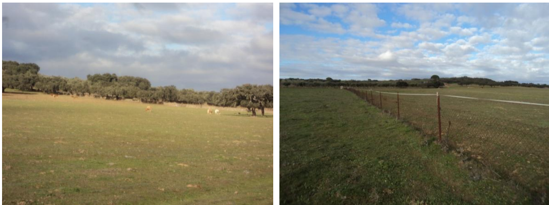
Figura 73 y 74: Paraje de los Llanos del Bogal (polígono 3 parcela 10) no se pudo entrar por presencia de ganado vacuno y bastón eléctrico sobre la valla