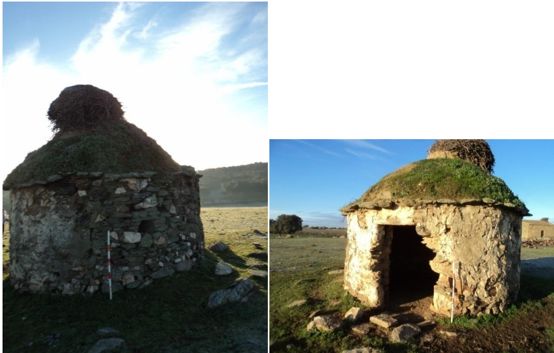
Figura 51 y 52: Chozo construido en mampostería de pizarra cuarzo y cuarcita, de planta circular con muros de 50 cm de grosor, la puerta tiene 1.60 metros de alto por 80 cm ancho, la cubierta está formada por una bóveda de aproximación de hiladas de pizarra y presenta enlucido de cal y arena. El alto total del chozo es de 3.50 metros y un diámetro de 3 metros y en su interior presenta pequeños vanos a modo alacena (3 alacenas y una ventana). Sus coordenadas son: UTM: 29N 714605/4226547.