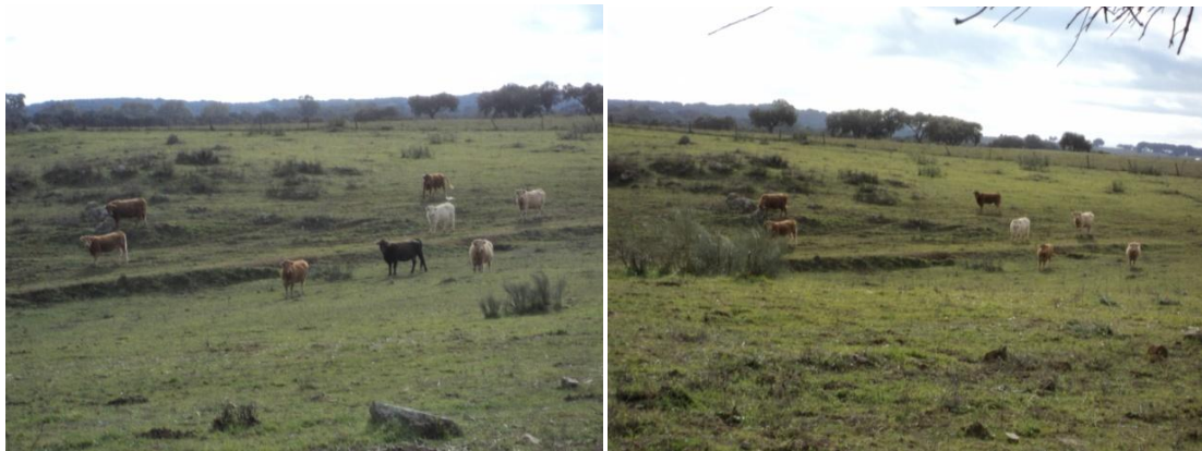
Figura 77 y 78: Paraje Cuesta Chica (Polígono 36 Parcela 4) donde acaba la línea se tuvo que rodear por presencia de ganado vacuno