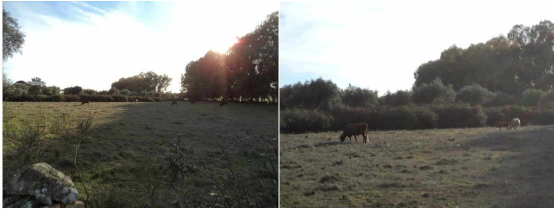
Figura 37 y 38: Parcela 37 del polígono 4, en el paraje denominado como Fuente Nueva en el cual tampoco pudimos acceder, dada la presencia de ganado vacuno.