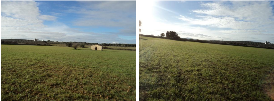
Figura 59 y 60: Vistas de los distintos paisajes que atraviesa la línea de evacuación aérea de Cincinato (Terrenos de cultivo, visibilidad optima)