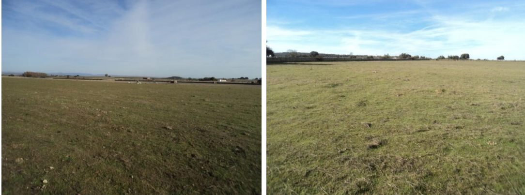
Figura 3 y 4: Vista del terreno parcelas situadas entre el Camino Padrón del Cercado Grande y la Vereda de Bodonal a Jerez de los Caballeros (Visibilidad óptima del terreno)