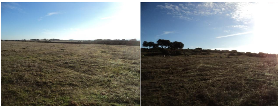
Figura 57 y 58: Vistas de los distintos paisajes que atraviesa la línea de evacuación soterrada de Cincinato (Terrenos llanos visibilidad óptima)

En lo que se refiere a la Línea de evacuación Cincinato, aérea, como hemos dicho se llevo a cabo por dos prospectores que parten de los polígonos que se hallan en ambos lados de la Vereda de Bodonal a Jerez y que fueron prospectadas en el día anterior. Esta línea se abre paso a lo largo de unos 8 kilómetros por terrenos muy diferentes, en algunas ocasiones muy difíciles para los prospectores en su avance. Parte del llano salpicado de encinas y formaciones rocosas de pizarra en forma de dientes de perro, y desde el inicio el recorrido supone atravesar una gran cantidad de parcelas todas con sus respectivos muros de piedra de mampostería, algunos derruidos y reforzados entonces con valla de alambre con espinos. E incluso algunas vallas estaban dotadas con pastores eléctricos.