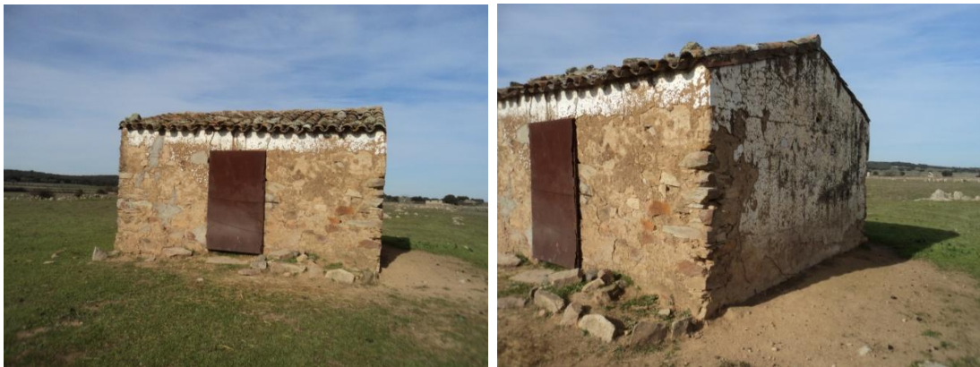
Figura 17 y 18: Presencia de otra casa contemporánea encalada para uso ganadero