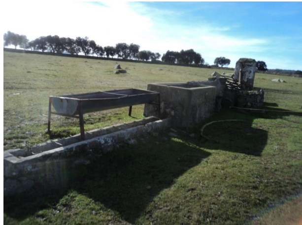
Figura 7 y 8: Presencia de algunos elementos de época contemporánea: pilones hechos de pizarra aglutinados con cemento.