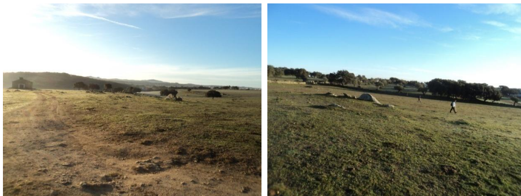
Figura 47 y 48: Parcelas de Cincinato que se hallan al otro lado de la BA 160, y en concreto los polígonos 6 parcela 78 perteneciente al paraje llamado El Castejón, y el polígono 6 parcela 79 perteneciente al paraje denominado como Piedra de la Zarza; ambos tienen un paisaje exactamente igual siendo este un llano con pasto muy bajo, con una buena visibilidad del suelo, para aprovechamiento ganadero porcino

exactamente igual siendo este un llano con pasto muy bajo, con una buena visibilidad del suelo, para aprovechamiento ganadero porcino.