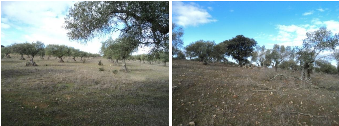
Figura 61 y 62: Vistas de los distintos paisajes que atraviesa la línea de evacuación de Cincinato (Olivares, visibilidad optima)