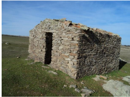
Figura 11 y 12: Presencia de algunos elementos de época contemporánea: casa de planta cuadrangular que en su tiempo estuvo techada a dos aguas con teja árabe sobre vigas de madera, y que actualmente se halla hundido.