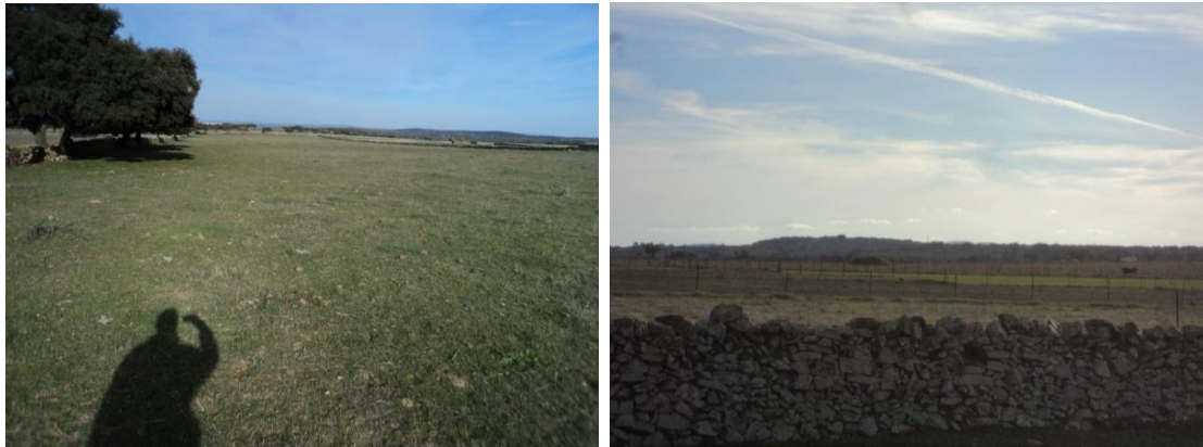
Figura 31 y 32: Detalle de aparcamientos con paredes de piedra (terreno llano, visibilidad óptima del suelo)