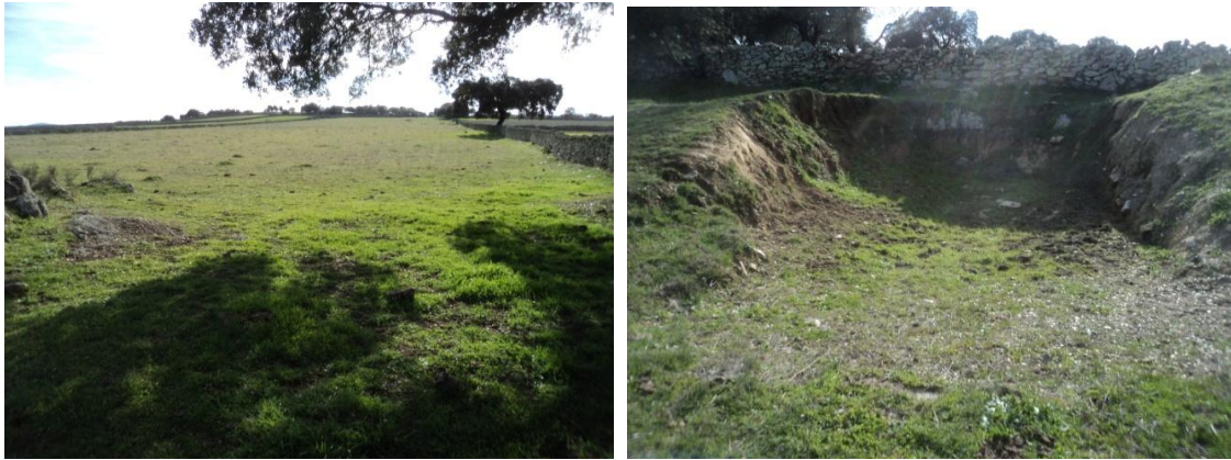
Figura 29 y 30: Detalle de aparcamientos con paredes de piedra (movimientos de tierra para hacer charcas para el ganado)