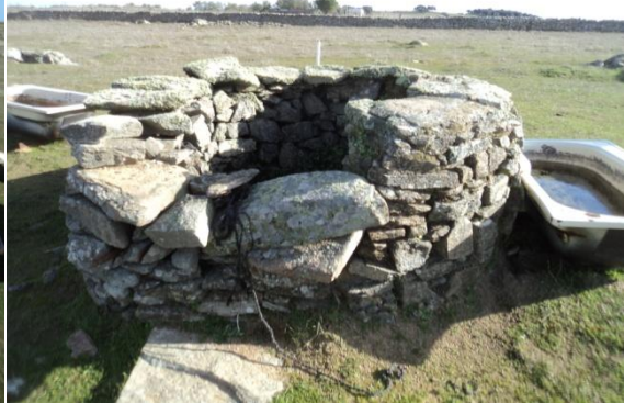
Figura 9 y 10: Presencia de algunos elementos de época contemporánea: pozo de planta circular también de pizarras