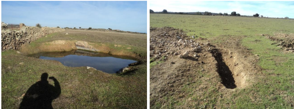
Figura 5 y 6: Se aprecian algunos movimientos de tierra contemporáneos para hacer charcas para abrevadero del ganado.