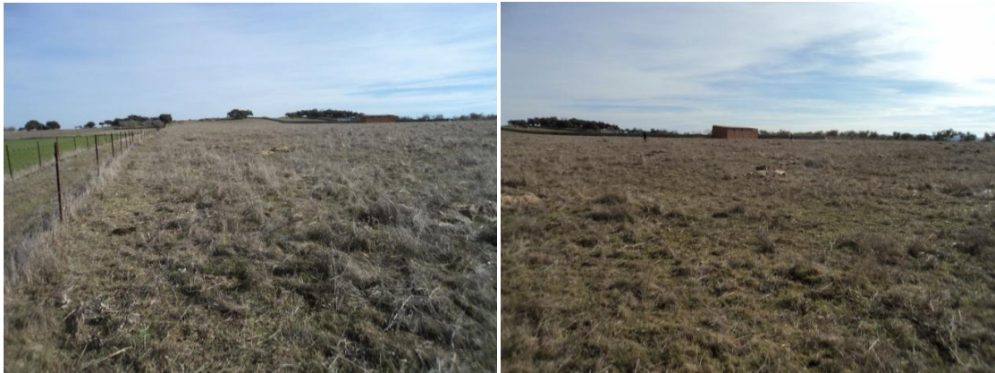
Figura 23 y 24: Parcela contigua a la Parcela 80 del polígono 4 donde el pasto era más alto que en las anteriores y la visibilidad del suelo era más reducida