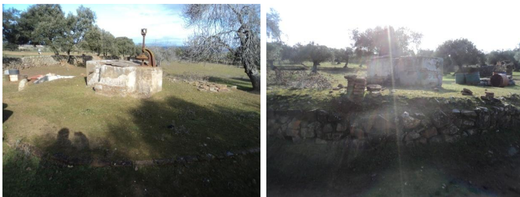
Figura 65 y 66: pozo de época contemporánea restaurado con cemento.

Por su parte decir, que hay zonas en las cuales fue necesario rodear y salirnos de la traza, dada la presencia de ganado vacuno o también porcino en las cuales no se pudo trabajar tales como el Paraje de los Llanos del Bogal (polígono 3 parcela 10), Paraje Cerca Nueva (Polígono 39 Parcela 11 y Polígono 37 parcela 3) y Cuesta Chica (Polígono 36 Parcela 4) donde acaba la línea. Por su parte decir que hay otros puntos en esta línea en la cual si se pudo trabajar bien como las zonas de olivar en la cual la visibilidad era optima por la presencia de ganado ovino o las zonas de llano con algunas encinas, o directamente terreno de dehesa donde el pasto no era muy alto. Por lo que se refiere a hallazgos no existe nada relevante salvo algún que otro pozo de época contemporánea restaurado con cemento o pilones para el abrevadero del ganado.