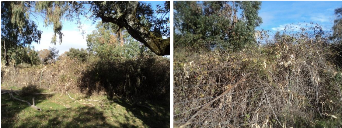
Figura 71 y 72: Zonas de zarzales que hubo que rodear sobre todo en las zonas de arroyos