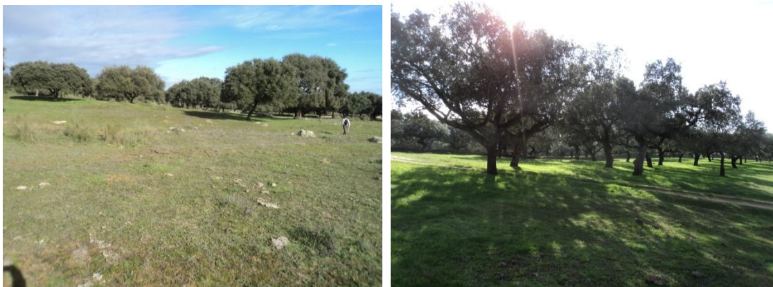
Figura 63 y 64: Vistas de los distintos paisajes que atraviesa la línea de evacuación de Cincinato (Dehesas, visibilidad optima)