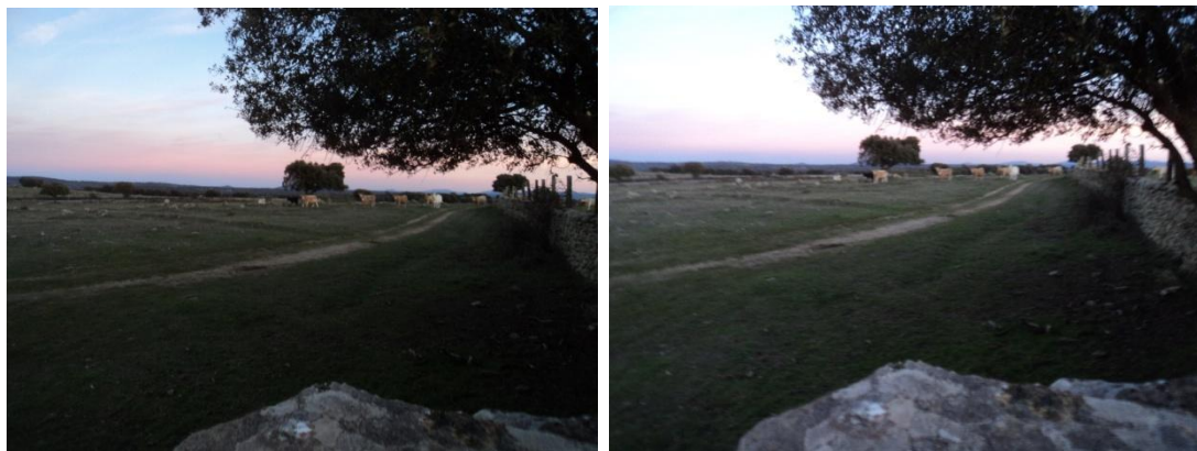
Figura 43 y 44: Paraje denominado San Miguel, en el que tampoco pudimos acceder dada la presencia de ganado vacuno obligándonos a rodearlo, en concreto es la parcela 7 del polígono 4

metros, un grosor de muro de 50 cm y un diámetro aproximado de unos 3 metros. Sus coordenadas son: UTM: 29 N 712951/4227972.