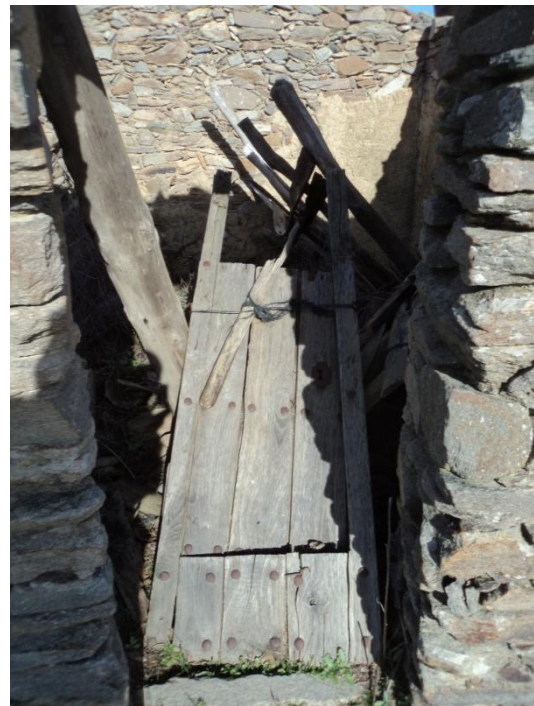
Figura 13 y 14: Presencia de algunos elementos de época contemporánea: casa de planta cuadrangular que en su tiempo estuvo techada a dos aguas con teja árabe sobre vigas de madera, y que actualmente se halla hundido.