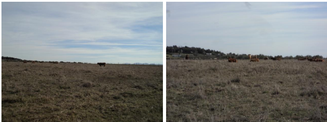
Figura 21 y 22: Parcela 80 del polígono 4 no nos fue posible el acceso ya que en ella había ganado vacuno

A continuación seguimos la prospección rebasando el Camino Padrón del Cercado Grande, lugar en el que nos encontramos con la primera incidencia en la prospección pues la parcela 80 del polígono 4 no nos fue posible el acceso ya que en ella había ganado vacuno, con lo cual se decide dar un rodeo para tratar de sortearlos. Rodeado el ganado comenzamos en la parcela contigua a esta donde el pasto era más alto que en las anteriores y la visibilidad del suelo era más reducida, y es aquí donde documentamos un pozo de brocal de ladrillo contemporáneo lucido de cemento. Tras esta parcela tratamos de adentrarnos en la siguiente, la parcela 84 del polígono 4 donde tampoco pudimos entrar también por la presencia de ganado vacuno, obligando al equipo a dar de nuevo un rodeo y a volver al coche para continuar con los siguientes parques.