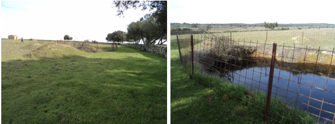
Figura 19 y 20: se observan movimientos de tierra para charcas de abrevadero.

A continuación seguimos la prospección rebasando el Camino Padrón del Cercado Grande, lugar en el que nos encontramos con la primera incidencia en la prospección pues la parcela 80 del polígono 4 no nos fue posible el acceso ya que en ella había ganado vacuno, con lo cual se decide dar un rodeo para tratar de sortearlos. Rodeado el ganado comenzamos en la parcela contigua a esta donde el pasto era más alto que en las anteriores y la visibilidad del suelo era más reducida, y es aquí donde documentamos un pozo de brocal de ladrillo contemporáneo lucido de cemento. Tras esta parcela tratamos de adentrarnos en la siguiente, la parcela 84 del polígono 4 donde tampoco pudimos entrar también por la presencia de ganado vacuno, obligando al equipo a dar de nuevo un rodeo y a volver al coche para continuar con los siguientes parques.