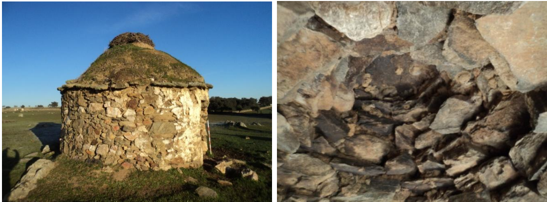
Figura 53 y 54: Chozo construido en mampostería de pizarra cuarzo y cuarcita, de planta circular con muros de 50 cm de grosor, la puerta tiene 1.60 metros de alto por 80 cm ancho, la cubierta está formada por una bóveda de aproximación de hiladas de pizarra y presenta enlucido de cal y arena. El alto total del chozo es de 3.50 metros y un diámetro de 3 metros y en su interior presenta pequeños vanos a modo alacena (3 alacenas y una ventana). Sus coordenadas son: UTM: 29N 714605/4226547.