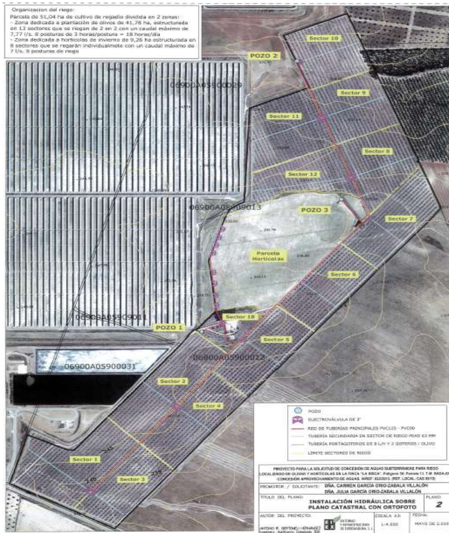
Sectorización de la parcela