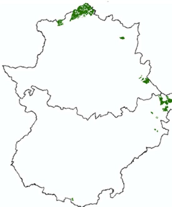
Localización de los montes del Catálogo de Utilidad Pública (CUP) certificados por PEFC.

Más allá de los instrumentos de planificación, ordenación y gestión forestal, cuando se trata de montes públicos y gestionados por la Administración forestal regional, la verificación de la sostenibilidad de esa gestión debe hacerse a través de sistemas formalmente acreditados , bien