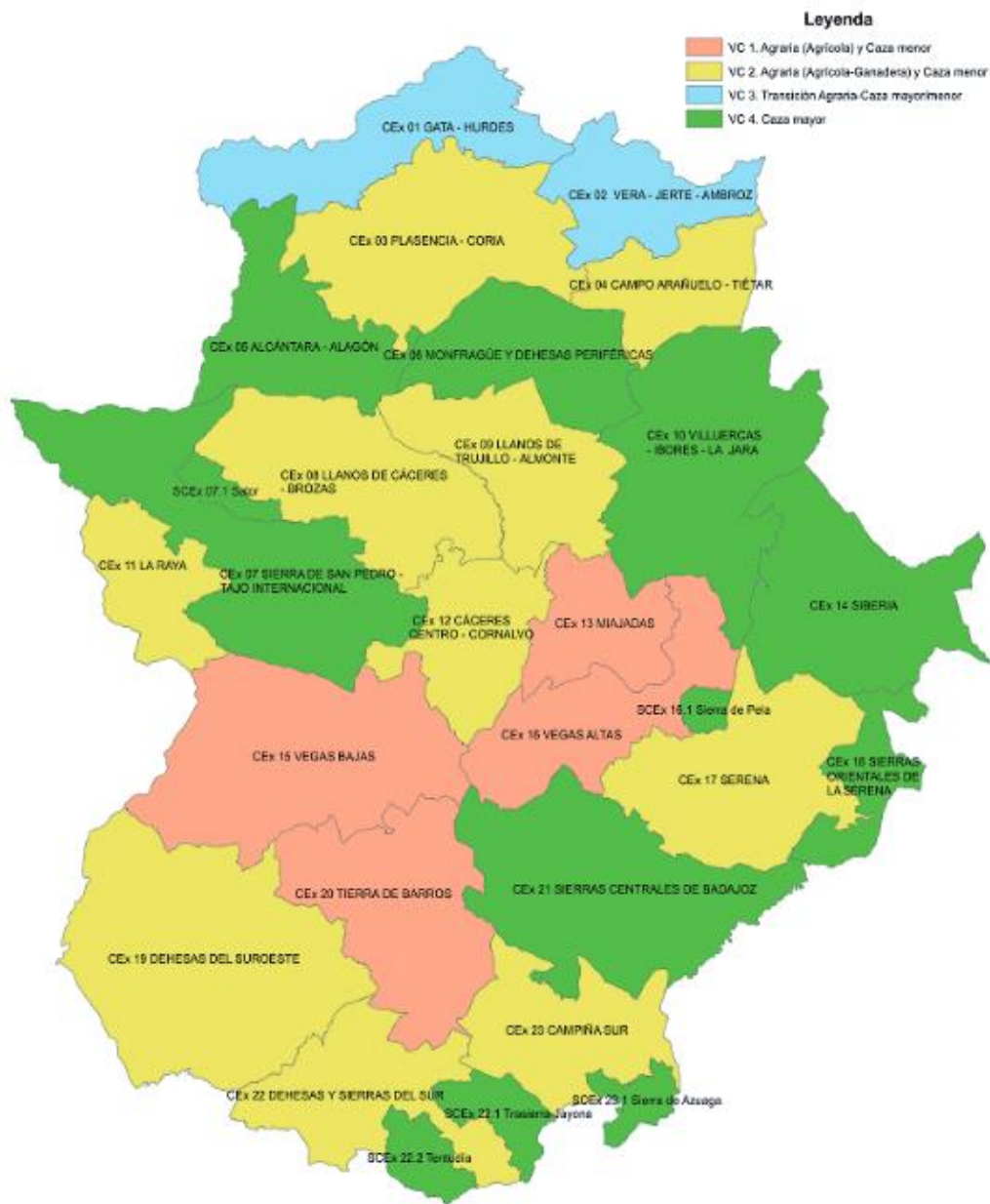
Plano Comarcas Cinegéticas de Extremadura y vocación