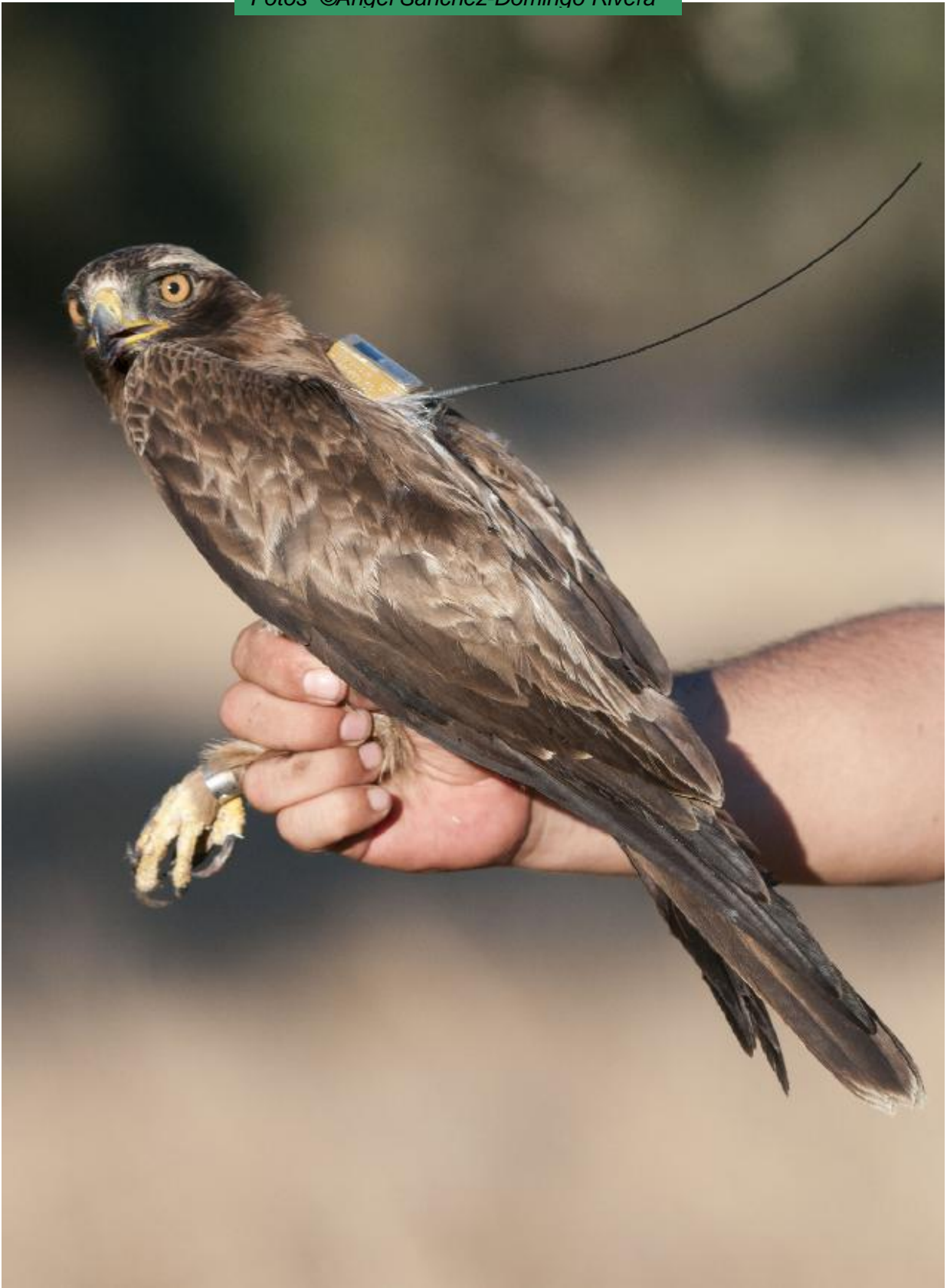
“Valiente” después de marcada y momentos antes de ser liberada