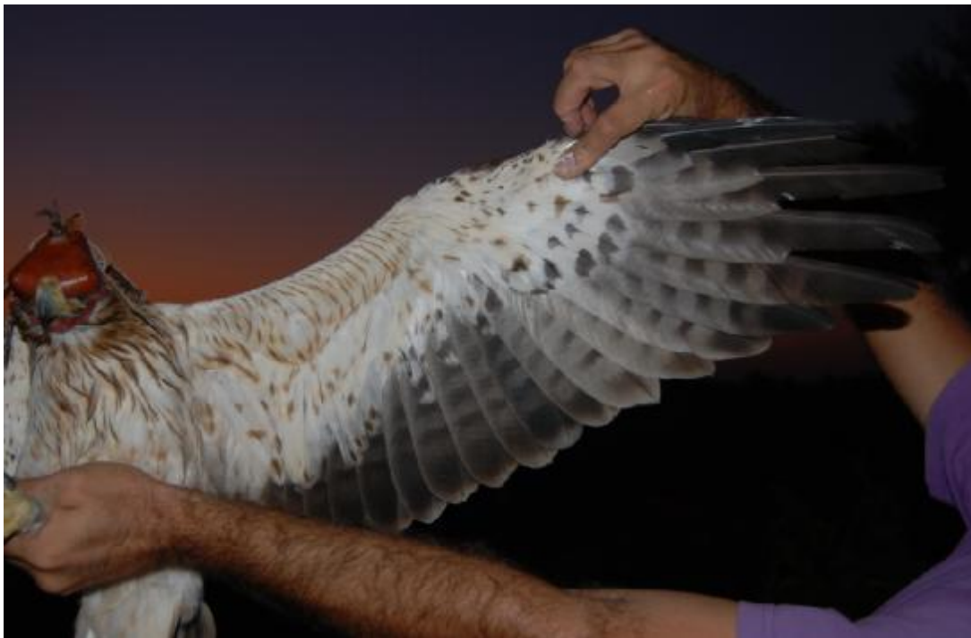
Diseño de las infracoberteras del ala izquierda de “Brava”. Se observa la fase clara de su plumaje