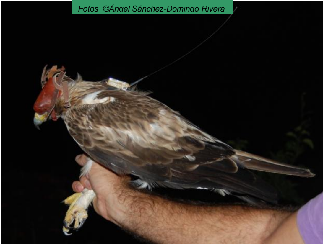
“Brava” después de colocado el emisor satélite.