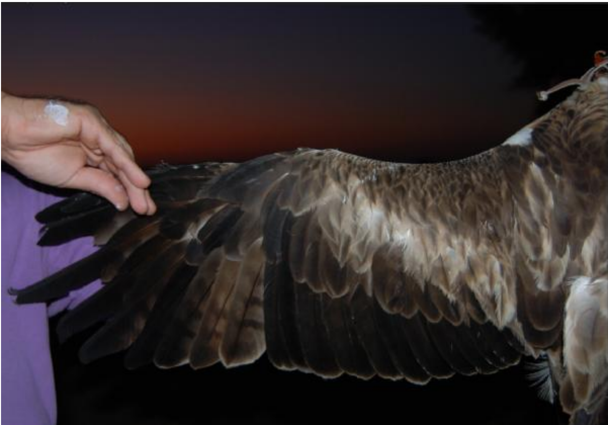
Diseño de las dos alas del aguililla calzada (“Brava”)